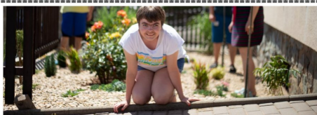
Diakonie Brno 2023

V brněnské Diakonii budeme příští rok slavit 30 let od jejího vzniku. Připravili jsme si pro vás stolní kalendář, abyste mohli s námi prožít celý rok.